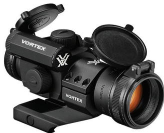
Optiune de montare a inelului de consola