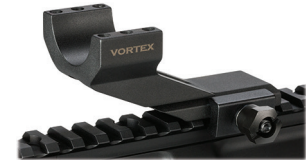
Jumatatea inferioara a suportului pentru inele

Pentru a preveni ranirea prin recul, pozitionati inelul astfel incat sa aveti cel putin patru centimetri de relief.